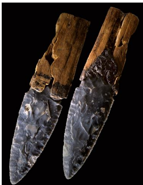
Recto et verso du célèbre poignard d'Allensbach, Kr. Constance (Bade-Wurtemberg). Le silex de la lame, qui date d'environ 2 900 av. J.-C., provient du nord de l'Italie. [...] (Photo : Y. Mühleis, Office national pour la conservation des monuments du Bade-Wurtemberg).